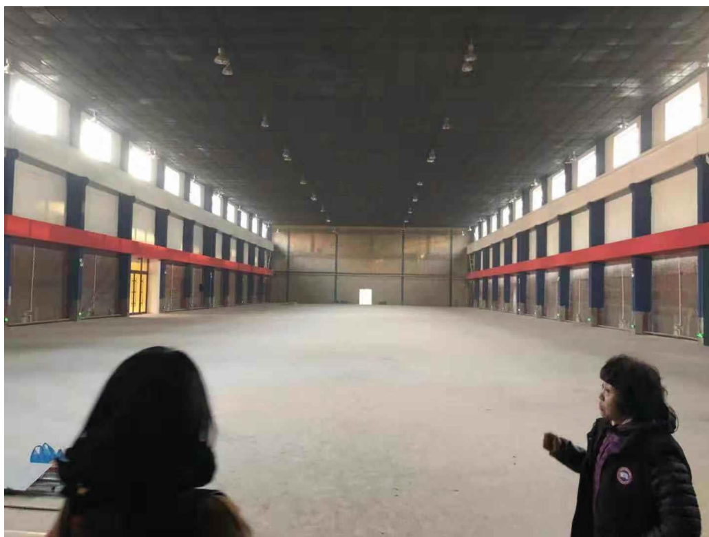
枫桥国际幼儿园室内 操场宽敞明亮