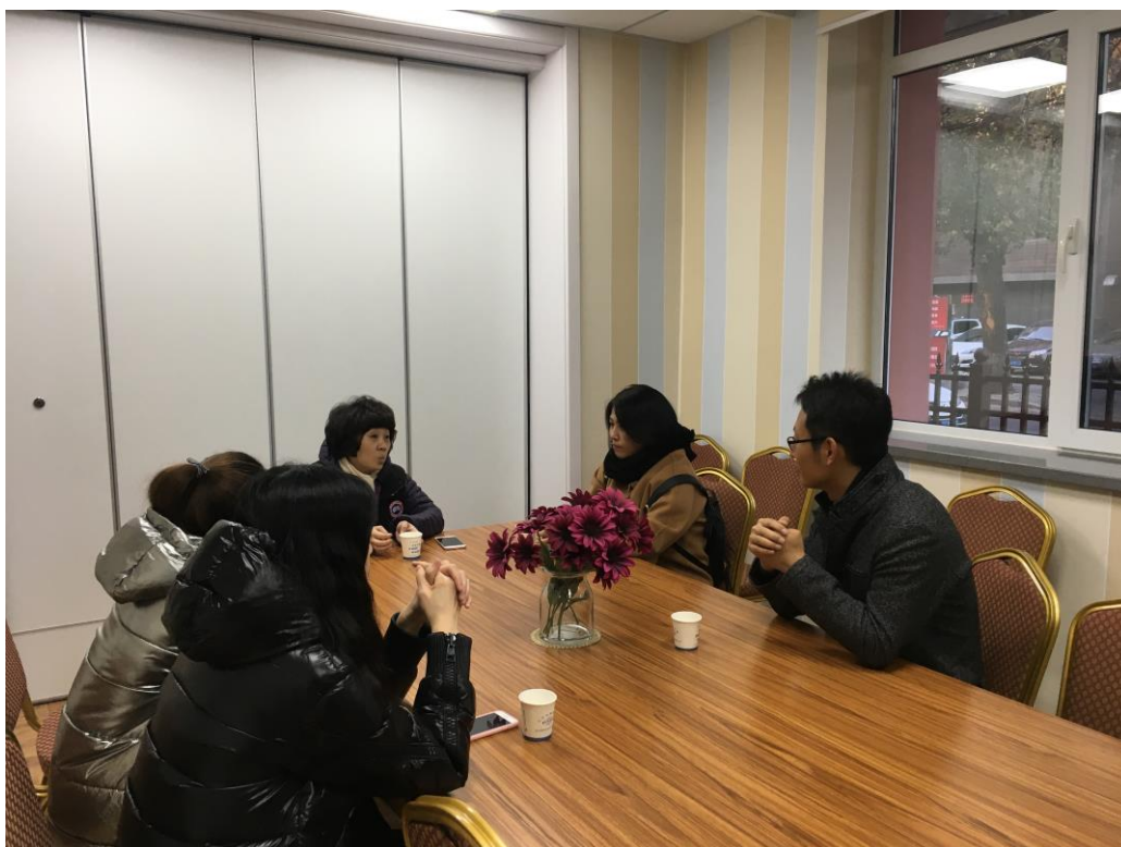
院地双方开展深入交流座谈，共同探讨幼儿体适能发展之路