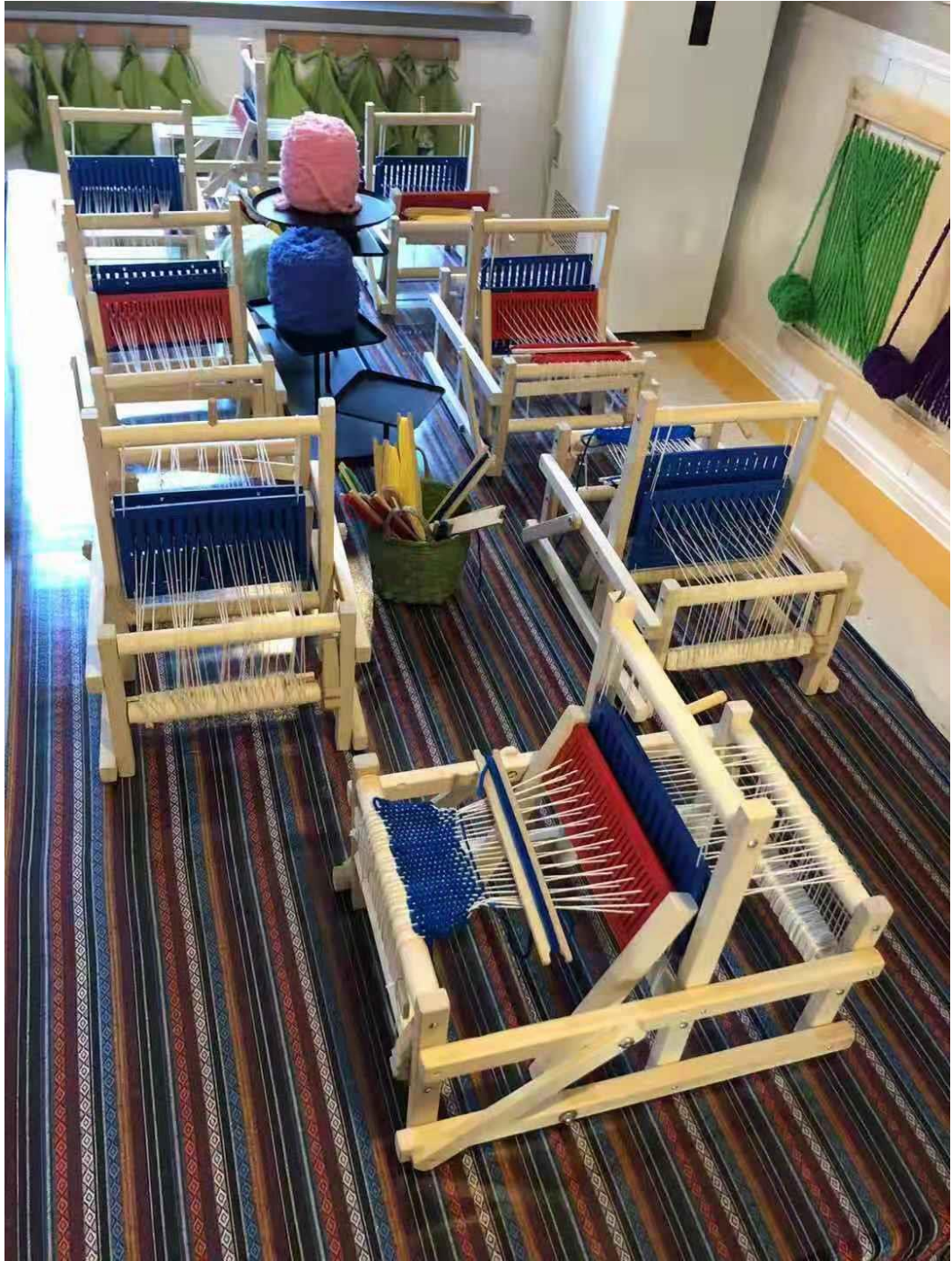
幼儿园孩子们的手工教室